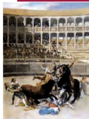
Plaza de Toros, pintado por Francisco de Goya. A la izquierda, cartel de la época.

“Cúchares practicaba un toreo alegre, movido, pródigo en recortes, con intuición y genialidad”.