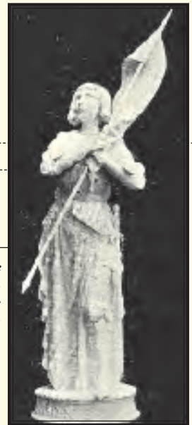
Escultura de Andrés Vermare, destinada a la Catedral de Orleans.

a la basílica para rezar ante la imagen de la bienaventurada y asistir a la bendición con el Santo Sacramento". Tal y como señalaba el semanario: "La afluencia de fieles era mayor aún que por la mañana y las tribunas presentaban un aspecto más elegante; y las señoras llevaban mantilla y los hombres frac y corbata blanca, según exige la etiqueta pontificia en presencia del Papa".