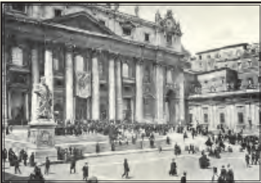
Arriba, Basílica de San Pedro. A la derecha, los descendientes directos de Juana de Arco.